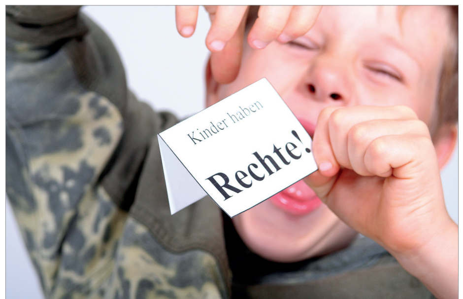
„Kinder erleben nichts so scharf und bitter wie Ungerechtigkeit.“ (Charles Dickens)

Ombudsstelle Kinderrechte Schweiz Theaterstrasse 29 8400 Winterthur info@kinderombudsstelle.ch www.ombudsstelle-kinderrechte-schweiz.ch